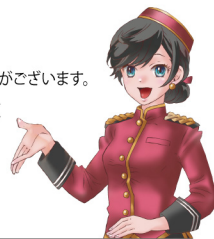
オリジナルキャラクター 八条もみじ